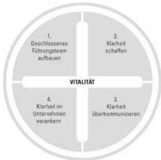
Abb. 1: Etappen zur Vitalität