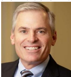
Patrick M. Lencioni

2) Die meisten Unternehmen nutzen nur einen Bruchteil der vorhandenen Intelligenz, Erfahrung und Wissensfülle. Die vitalsten Unternehmen schaffen es jedoch, die vorhandene Intelligenz besser einzubinden. Es kommt zu einem Multiplikatoreffekt.